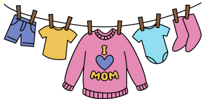
Des vêtements de rechange