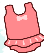
Un maillot de bain