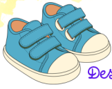
Des chaussures adaptées