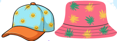
Un chapeau ou une casquette