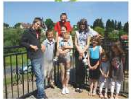
Devoir de mémoire le 8 mai