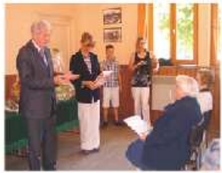
Médaille de la famille