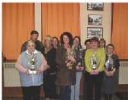
Remise des colis au personnel